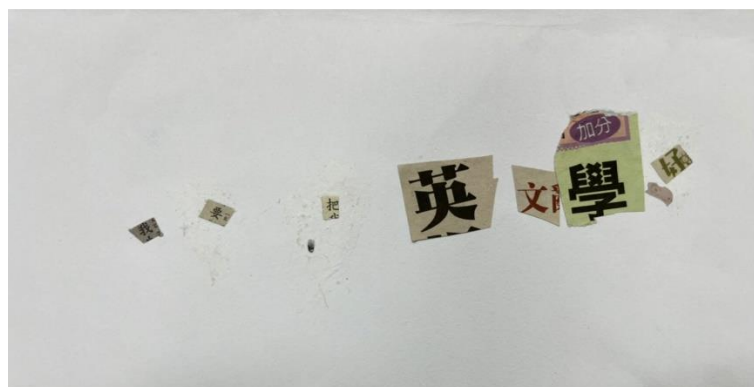
組別 B 之作品