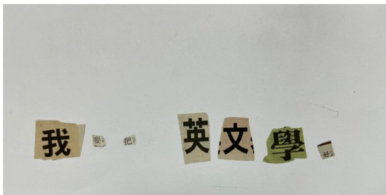
組別 A 之作品

內容：兩組學生透過團隊合作將報紙上的字組合拼湊成題目之句子，並在完成後分享活動中所看見對方的優點。