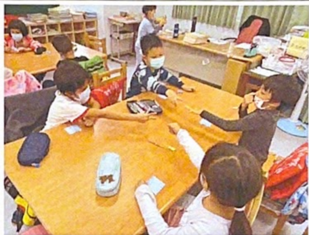
▲小組同學也可以用猜拳表達意見