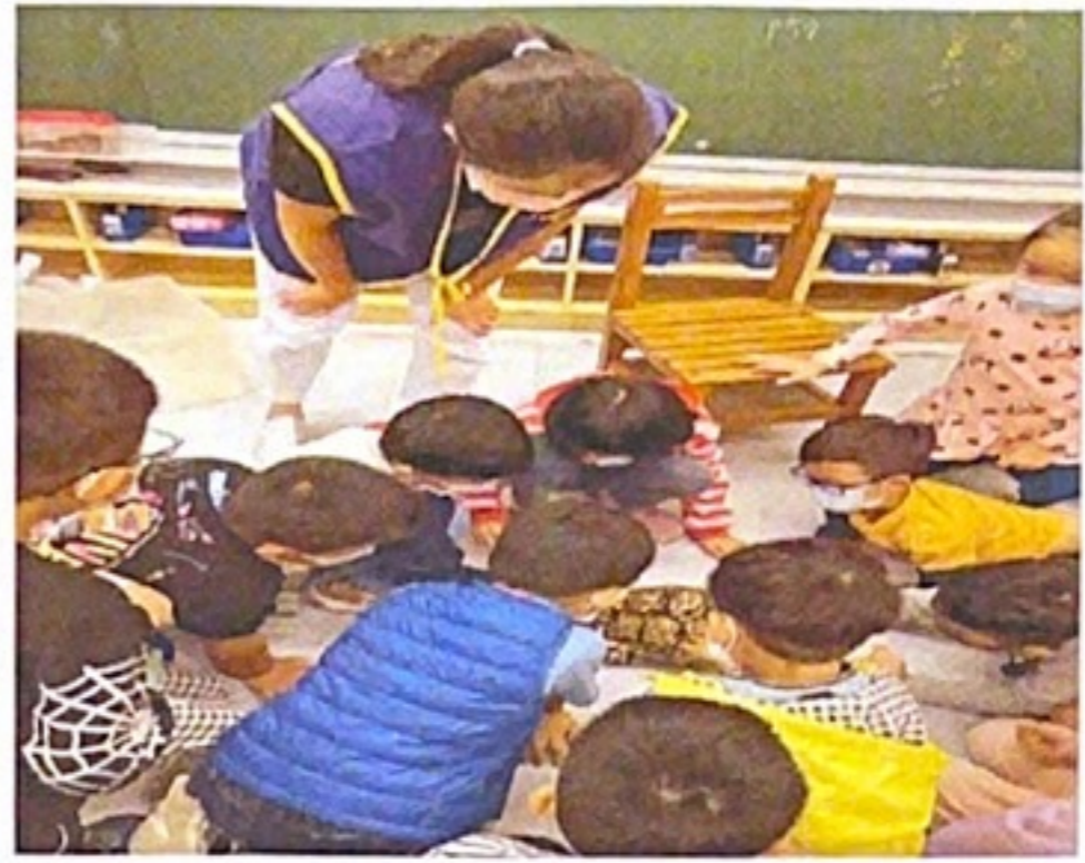
▲邀請志工家長帶陸龜做生命教育