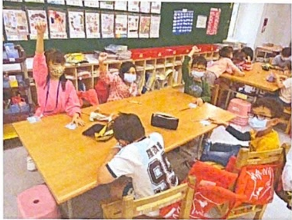
▲小組同學可以用投票表達意見