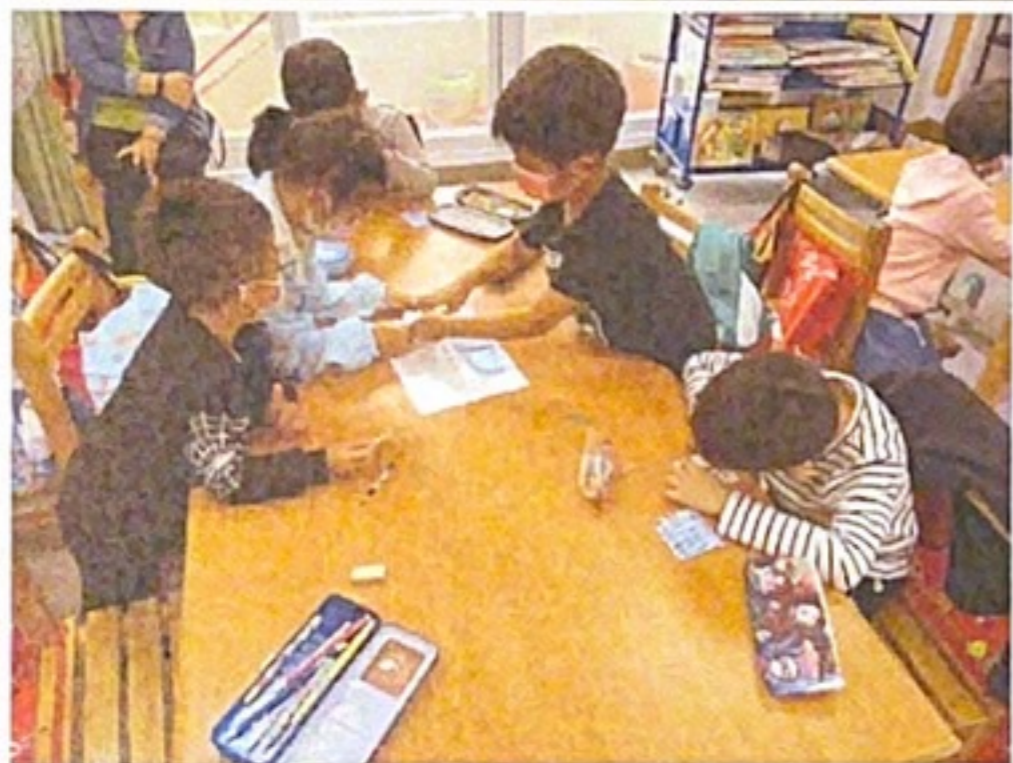
▲同學用便條紙寫下對他人的回饋