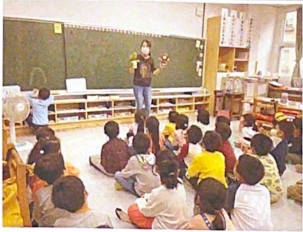
▲教師用布偶演出狀況劇引發思考