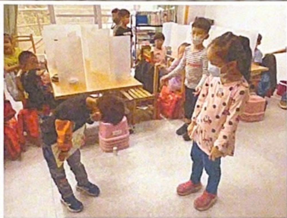
▲溝通澄清誤會道歉後還是好朋友